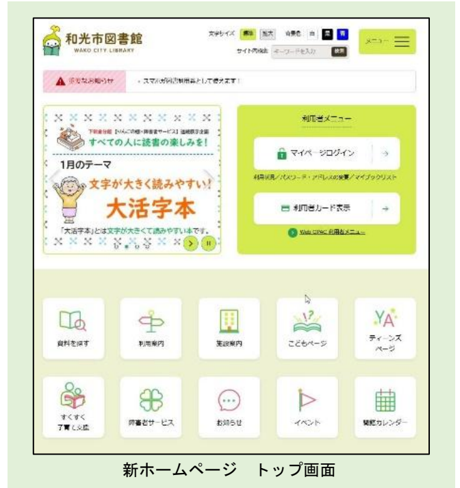
新ホームページ トップ画面