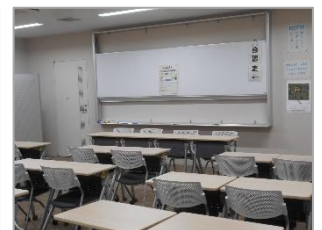
【分館】会議室開放時 の様子