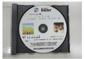
マルチメディアデージー