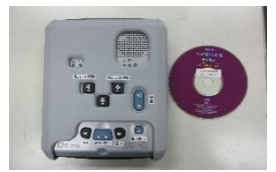
音声デージー再生機