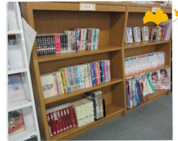
本館 漫画コーナー