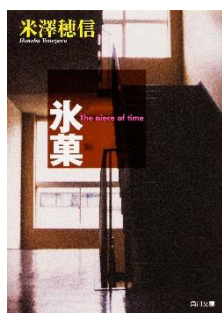
『氷菓』 米澤 穂信//著 資料コード：11214887

こちらの本は、 和光国際高校の 生徒さんが デモンストレーションで 紹介して下さいました！