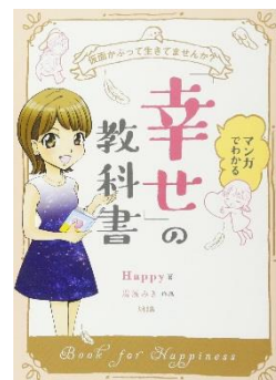
『マンガでわかる「幸せ」の教科書』 Happy//著 ※蔵書の無い資料になります。他館からのお取り寄せをご希望の方はカウンターへご相談ください。

こちらの本は、 和光国際高校の 生徒さんが デモンストレーションで 紹介して下さいました！