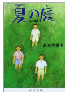
『夏の庭』 湯本 香樹実//著 資料コード：11242521