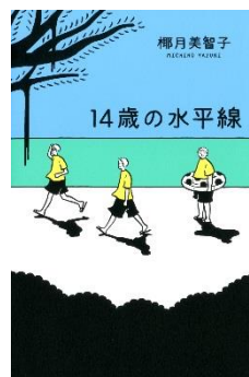
『14歳の水平線』 柳月 美智子//著 資料コード：11217880