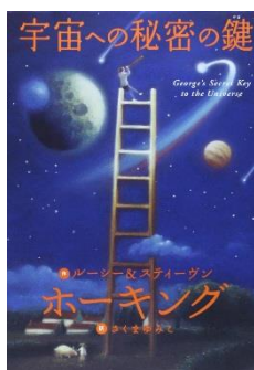
『宇宙への秘密の鍵』 スティーヴン ホーキング//著 資料コード：12110339