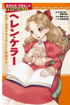
『ヘレン・ケラー』 海野 そら太//イラスト 資料コード：12131779