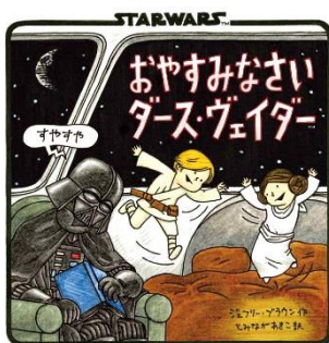
『おやすみなさいダース・ヴェイダー』 ジェフリー・ブラウン//著 ※蔵書の無い資料になります。他館からのお取り寄せをご希望の方はカウンターへご相談ください。