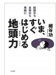
細谷功『いま、すぐはじめる地頭力』 大和書房 336.2

「地頭」という言葉に興味を持ち、自分の「地頭」を鍛えてみたくなった方はいまがチャンスです。いますぐ、地頭力のトレーニングにチャレンジしてみましょう!